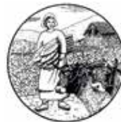
ASSOCIACIÓ DE PAGESOS I RAMADERS D'ANDORRA